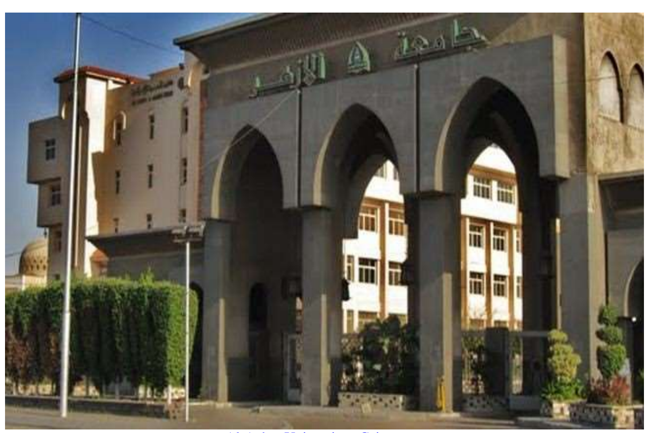
Al-Azhar University - Cairo