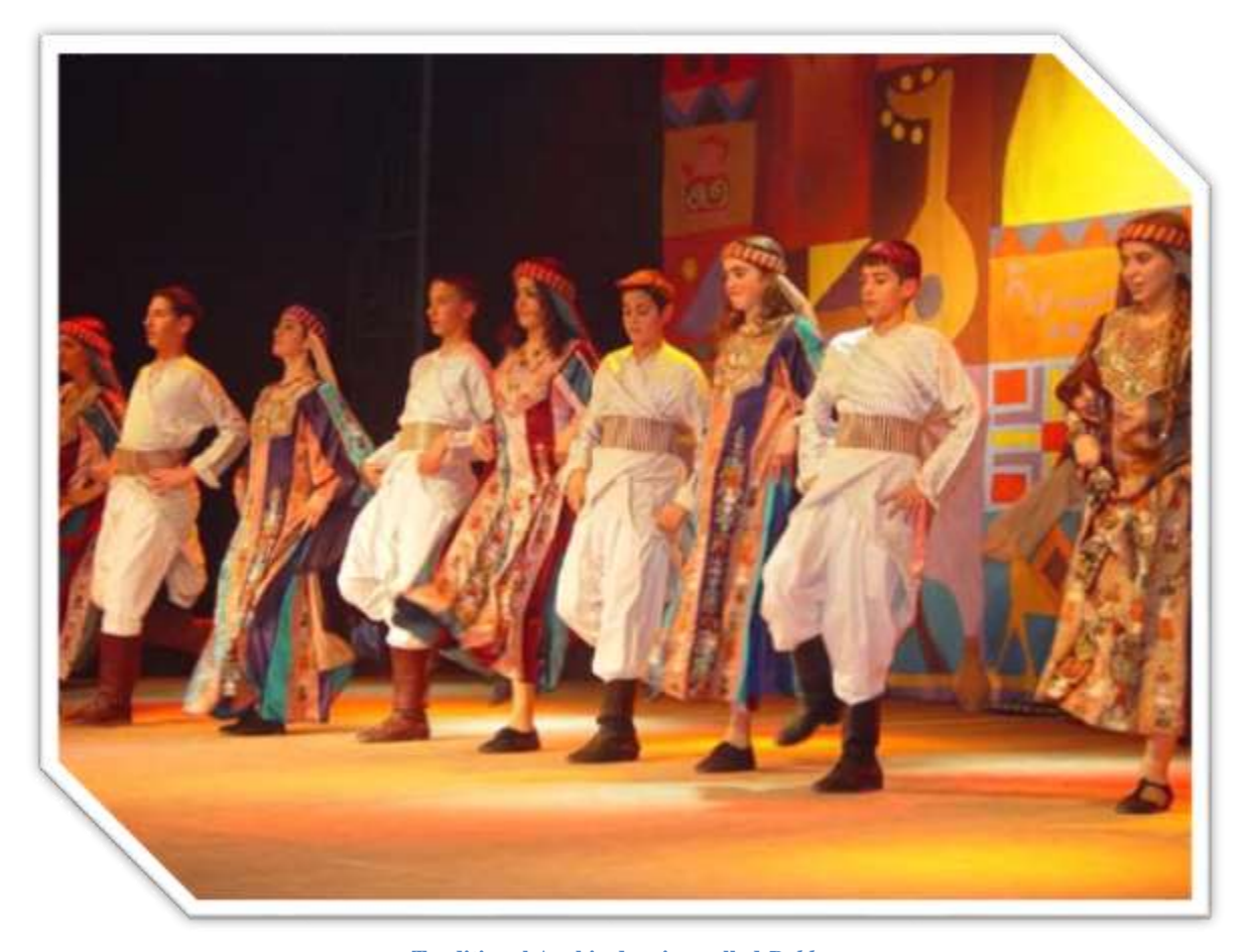
Traditional Arabic dancing called Debke